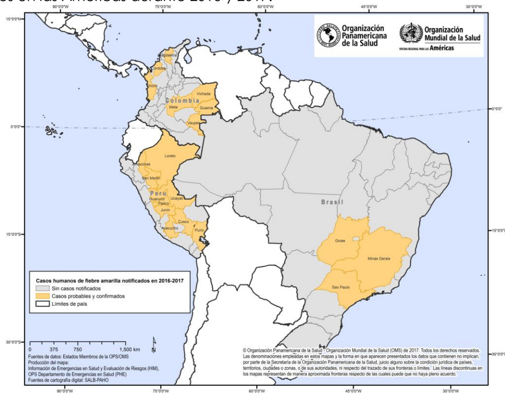
Figura 1. Ubicación geográfica de casos probables y confirmados de fiebre amarilla notificados en las Américas durante 2016 y 2017.

Brasil confirmó seis casos de fiebre amarilla durante 2016 1 y el número de epizootias, especialmente en el estado de São Paulo, durante 2016 aumentó considerablemente en comparación a los años anteriores. En efecto, desde el inicio del año y hasta el 12 de diciembre de 2016 en el estado de São Paulo se notificaron 163 epizootias en primates no humanos (PNH) con un total de 227 animales afectados. Hasta la fecha de elaboración de este informe un total de 16 epizootias (correspondientes a 24 PNH) fueron confirmadas y otras 35 fueron descartadas. Las restantes continúan bajo investigación.